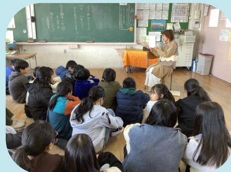
読み聞かせの様子