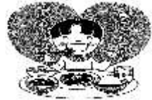
好き嫌いしなかった