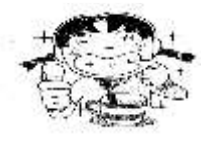
朝晩、はみがきをした