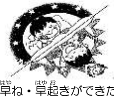
早ね・早起きができた