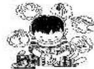
手洗いをがんばった