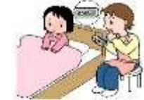
病気をしなかった