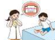
けがをしなかった