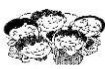
友達と仲良くできた