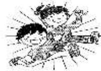
元気に外で遊んだ